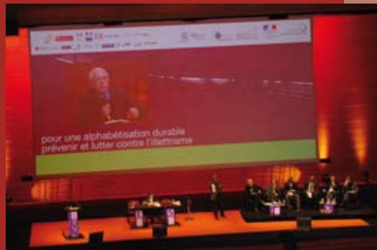
Séance de clôture, réactions des grands témoins (ici Philippe Meirieu) après la présentation des recommandations

La décentralisation doit être pensée pour respecter et promouvoir la dimension locale, dans l'utilisation des langues locales notamment, Promotion d'une culture nationale : il s'agit de favoriser au départ les apprentissages bilingues et si possible multilingues pour aller ensuite vers la langue officielle ou de communication,