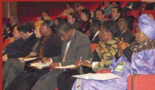
Les ministres de l'éducation présents ont activement participé aux travaux, ici aux cotés de Roland Debbasch, Recteur de l'Académie de Lyon

Etablir une bonne articulation et complémentarité entre les politiques nationales et les stratégies de développement régional d'alphabétisation et d'éducation.