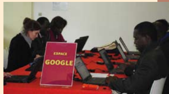
Lancement officiel du portail www.google.fr/literacy en partenariat avec l'Unesco, Litcam et l'Anlci le 12 février 2009