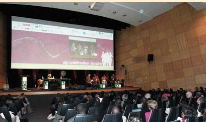
Séance d'ouverture, mercredi 10 février à l'ENS Sciences.