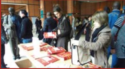
Stand ANLCI à la cité internationale, diffusion des outils mis à disposition de tous